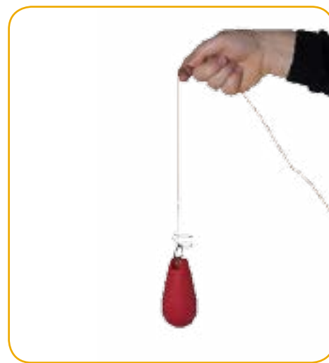
Bonne prise en main