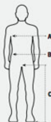
Tableau des tailles StretchZone®