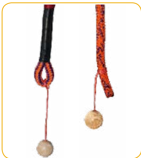
Tête d'alouette et prussik